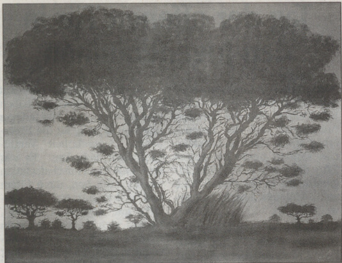
Das Bild „Afrika“ des Künstlers Alois Breitung.